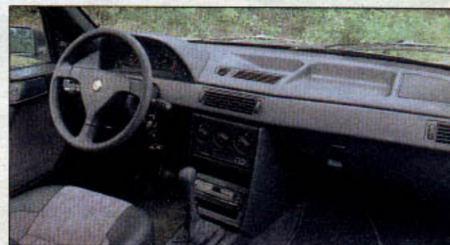
Martin Rook: "Jammer dat het stuur alleen in hoogte verstelbaar is."